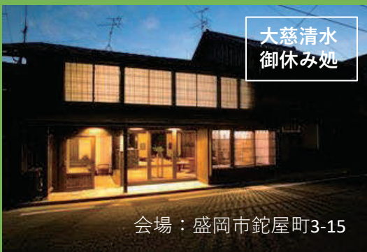
大慈清水 御休み処